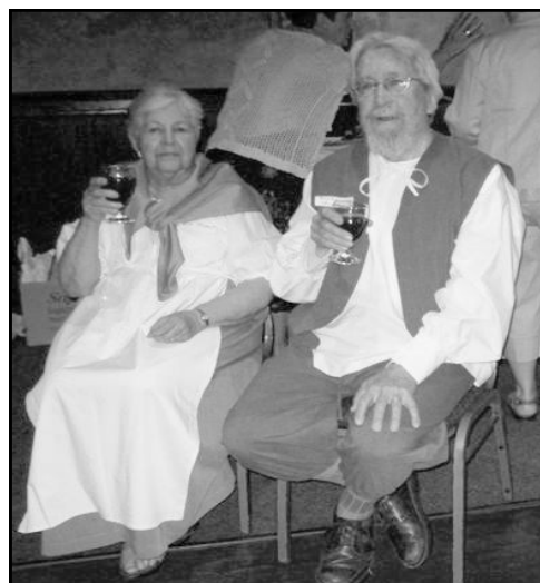
Un verre à la santé des Choquet-te !