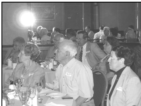
À l'écoute du président d'assemblée...