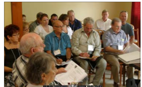
On participe avec sérieux.