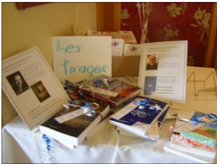
Les prix de tirages sont en exposition à l'entrée de la salle.

N.B.: Merci à ces deux auteurs (voir page 22)