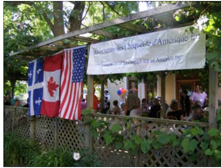
La terrasse est décorée pour la circonstance.