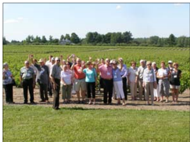
Les participants ont fort apprécié la visite du vignoble l'Orpailleur.