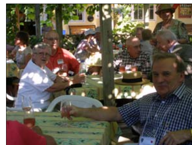
On profite de la terrasse, lors du cocktail.