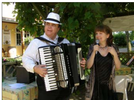
On chante au son de l'accordéon sous la vigne.