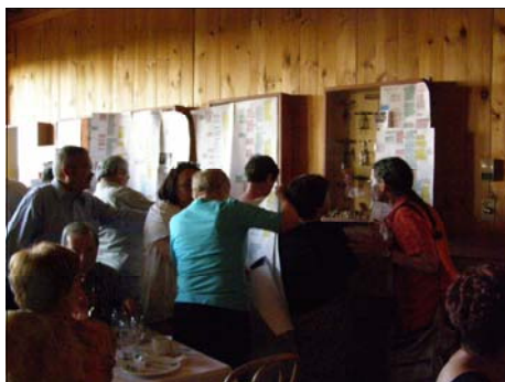
Les tableaux suscitent un vif intérêt.