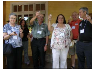
On salue la parenté en levant son verre.