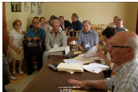
On écoute le président André Choquette.