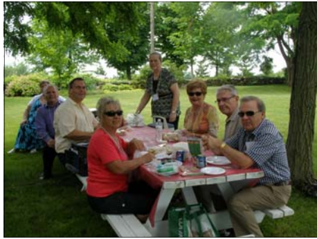
Des membres du CA font un pique-nique avant de s'activer aux préparatifs.