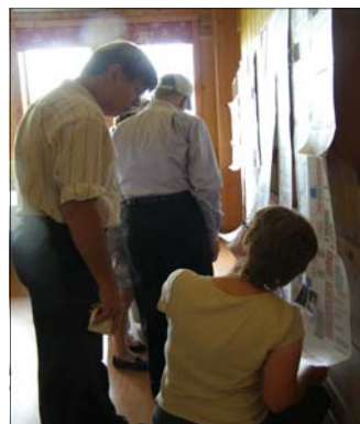
Moi aussi, je cherche le mien...